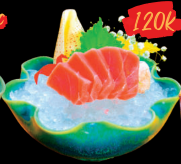
20 Sashimi Maguro Sashimi Cá Ngừ