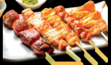
10 Xiên Yakitori 10 Moriawase