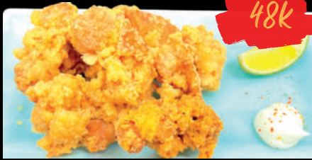
67 Karaage Gà chiên