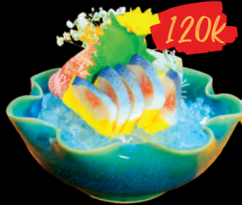
24 Sashimi Nishin Sashimi Cá Trích