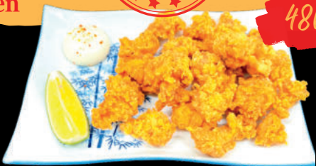
68 Nankotsu Karaage Sụn Gà chiên