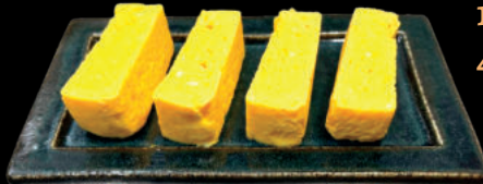
Trứng cuộn Dashi Maki

Đậu nành luộc - Edamame 8 Xiên - Yakitori 8 Moriawase Salad khoai tây - Poteto sarada Bạch tuộc sống trộn mù tạt - Takowasa Cá Trứng chiên - Shishyamo Mì Soba xào - Yakisoba