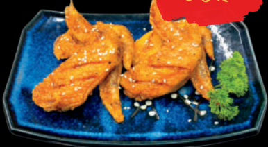
70 Tebasaki Cánh Gà chiên