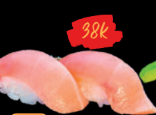
28 Tsuna Sushi cá Ngừ