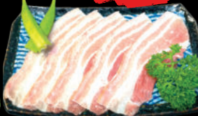
63 Tonbara Ba chỉ Heo 100g