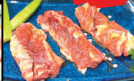
65 US nakauchi karubi Dẻ sườn Bò Mỹ 100g