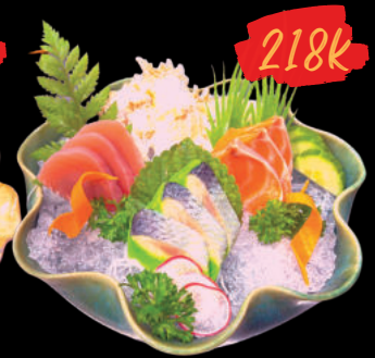
22 Sashimi 3 ten mori Sashimi 3 loại