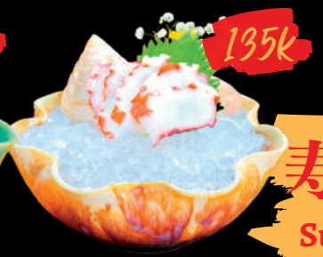
25 Sashimi Tako Sashimi Bạch Tuộc