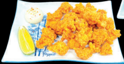
Sụn Gà chiên Nankotsu Karaage