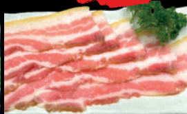
64 Inoshishi Thịt heo rừng