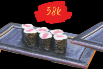
38 Tsuna Maki Cơm cuộn cá Ngừ