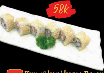
35 Kyu-ri kani kama Ro-ru Cơm cuộn thanh cua