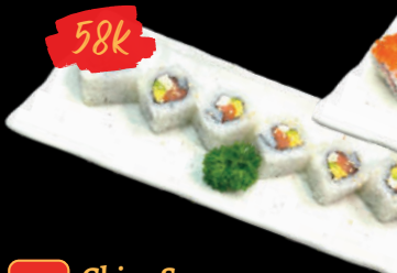
32 Chizu Sa-mon ro-ru Cơm cuộn cá Hồi phô mai