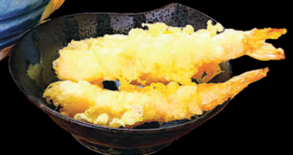
Udon - Ebi Tempura ( Atatakai/Tsumetai ) 94 Mì Udon Tôm Tempura ( Nóng/Lạnh )