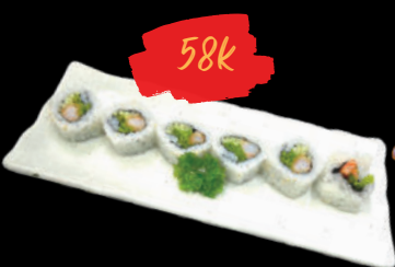
36 Ebi tempura ro-ru Cơm cuộn Tôm Tempura