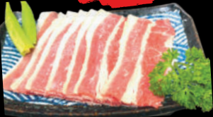
62 Gyu Bara Ba chỉ Bò 100g