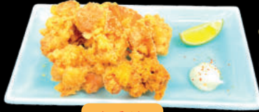
Gà chiên Karaage