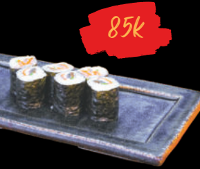
39 Unagi Maki Cơm cuộn lươn