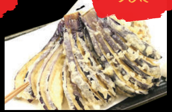
74 Nasu Tempura Cà tím Tempura