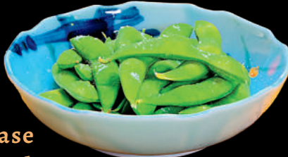
Đậu nành luộc Edamame

Đậu nành luộc - Edamame 5 Xiên - Yakitori 5 Moriawase Salad khoai tây - Poteto sarada Trứng cuộn - Dashi Maki Gà chiên - Karaage