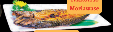
Cá Saba nướng Saba Yaki