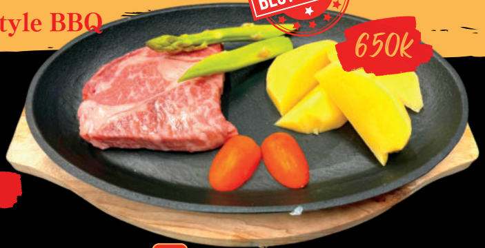
60 BBQ Wagyu Bò Wagyu 100g