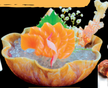
Sashimi cá Hồi Sashimi Sa-mon