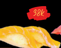
27 Sa-mon Sushi cá Hồi