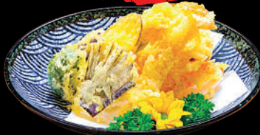
71 Tempura Moriawase Tempura tổng hợp