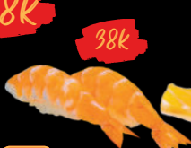
26 Ebi Sushi Tôm