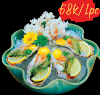
19 Sashimi Nihon Kaki Sashimi Hàu Nhật