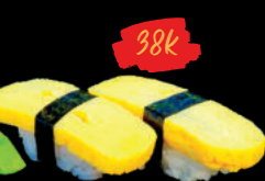
30 Dashi Maki Sushi trứng cuộn