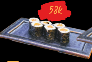
37 Sa-mon Maki Cơm cuộn cá Hồi