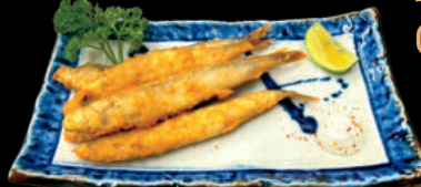
Cá Trứng chiên Shishyamo

Đậu nành luộc - Edamame 5 Xiên - Yakitori 5 Moriawase Sụn Gà chiên - Nankotsu Karaage Dưa leo tẩm gia vị - Piri 辛 Kyūri Trứng cuộn trứng cá Tuyết (Men Dashi Maki) Sashimi cá Hồi - Sashimi Sa-mon Lẩu Hải Sản - Kaisen Nabe