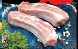
66 Supearibu Sườn non Heo