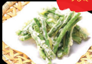
73 Ingen Tempura Đậu que Tempura