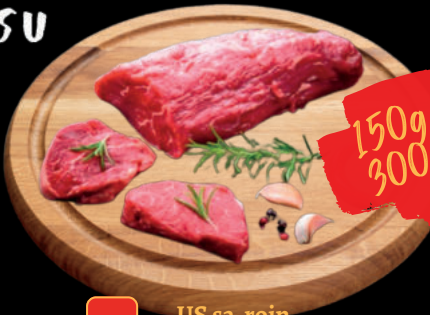
61 US sa-roin Thăn nội bò Mỹ