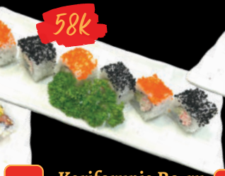
33 Kariforunia Ro-ru Cơm cuộn California