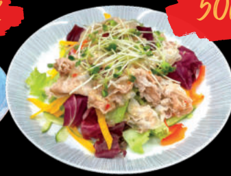
11 Toku Kaisen Sarada Salad Hải Sản đặc biệt