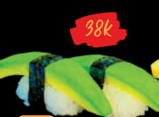
29 Abogado Sushi Bơ