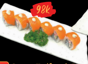
34 Sa-mon Kariforunia Ro-ru Cơm cuộn cá Hồi California