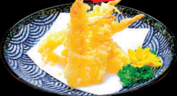
72 Ebi Tempura Tôm Tempura