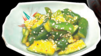
Dưa leo tẩm gia vị Piri 辛 Kyūri