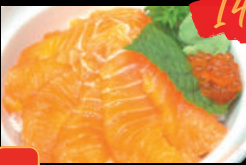
23 Sa-mon ikuradon Cơm cá Hồi và trứng cá Hồi