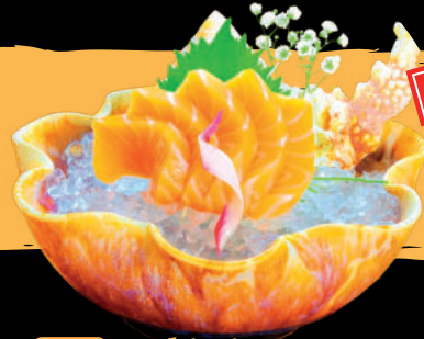
18 Sashimi Samon Sashimi cá Hồi