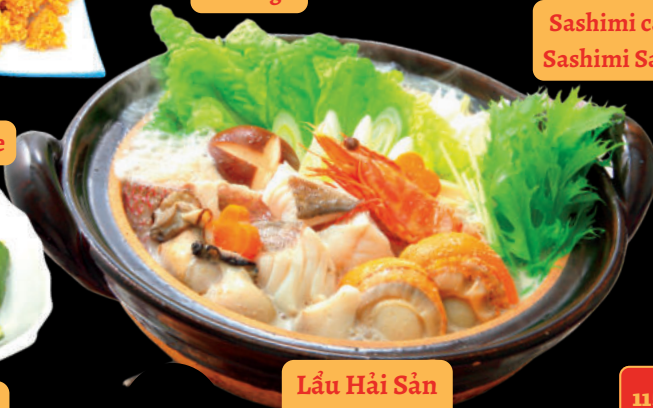
Lẩu Hải Sản Kaisen Nabe