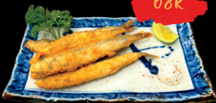
69 Shishyamo Cá trứng chiên