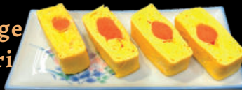
Trứng cuộn trứng cá Tuyết (Men Dashi Maki)