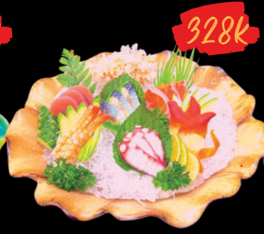
21 Sashimi 6 ten mori Sashimi 6 loại